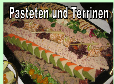
Pasteten und Terrinen

Riesengarnelen in Knoblauchsauce Shrimps in Sherryessig und Traubenkernöl Matjesfilet auf Zwiebel-Apfelsahne Mozzarella mit Fleischtomate in Balsamico Honigmelone mit Parmaschinken Geflügelcocktail Platte mit verschiedenen Pasteten und Terrinen Gefüllte Poulardenbrüstele Gegrillte Hochrippe Osso Bucco Pistazienreis und Champignonnudeln